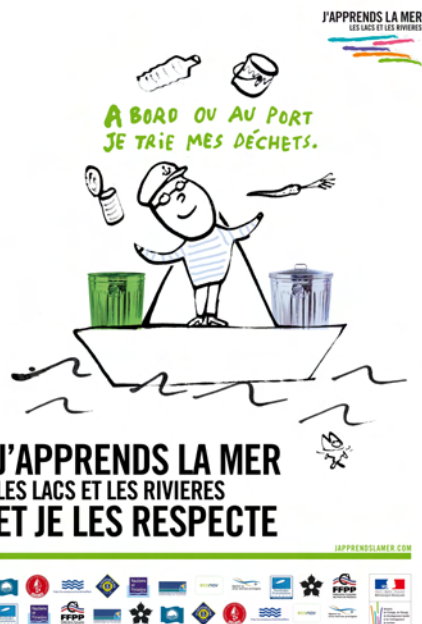
Exemple d'affiche de la campagne